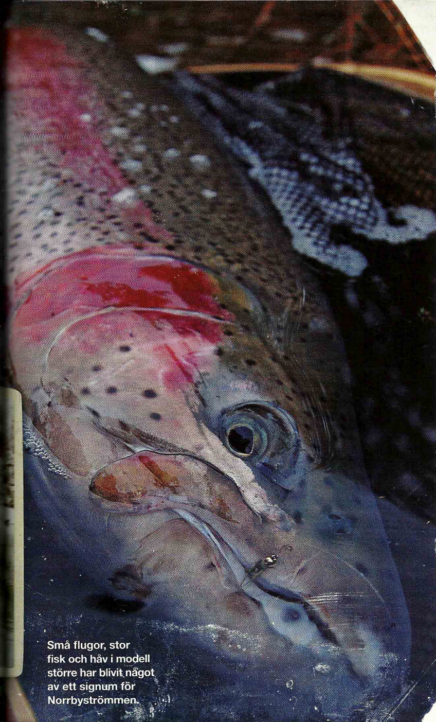
Små flugor, stor fisk och håv i modell större har blivit något av ett signum för Norrbyströmmen.