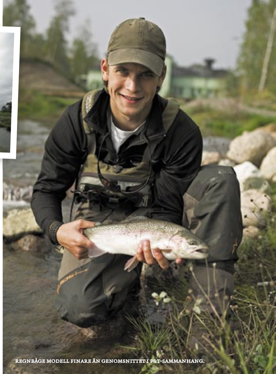
REGNBÅGE MODELL FINARE ÄN GENOMSNITTET I P&T-SAMMANHANG.

Poolerna är av varierande karaktär och precis lagom i storlek för att kunna fiskas med god kontroll. Det är även i dessa vi finner flest fiskar. Från starten vid huset och ner till sammanflödet med Motala ström